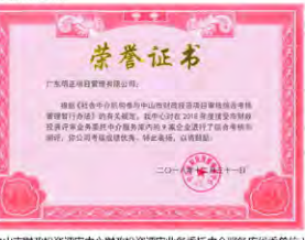
(中山市财政投资评审中心财政投资评审业务委托中介服务机构优秀单位)

2. 中山市财政投资评审中心对在2018年度接受市财政投资评审业务委托中介服务机构考核和测评中，我司的考核成绩优秀，荣获由中山市财政投资评审中心颁发的优秀单位荣誉证书。