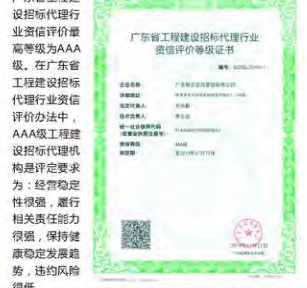
(广东省工程建设招标投标行业资信评价等级AAA级证书)

3. 2019年1月22日，我司荣获广东省建筑业协会颁发的“广东省工程建设招标投标行业资信评价等级AAA级证书”。