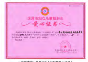
(珠海市妇女儿童福利会颁发的爱心证书)

4. 2018珠海市妇女儿童福利会慈善之夜中，我司积极参与慈善竞拍，最终夺得“意大利多娜佳礼服套装”，所拍善款15000元将捐赠到“2019年小天使助学”项目，资助贫困儿童5名，获得珠海市妇女儿童福利会颁发的爱心证书。